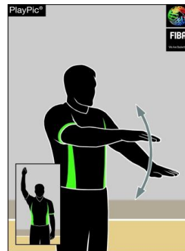
Dribble illégal / double dribble